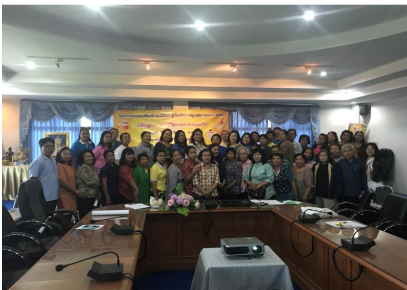
ภาพที่ ๗-๑๘ บรรยายให้ความรู้โดยทีมวิทยากรจากโรงพยาบาลส่งเสริมสุขภาพตำบลบ้านป่าแก้ว