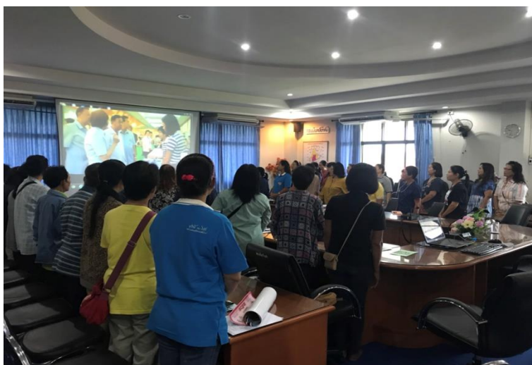
ภาพที่ ๔-๖ ผู้เข้ารับการอบรมร่วมร้องเพลง เทิด...พระบิดา