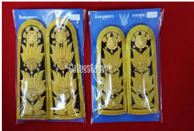
ภาพที่ ๒๕ : อินทรรูปของเครื่องแบบพิธีการ (ชุดปกติขาว) ตำแหน่งระดับ ๙ ขึ้นไป

พนักงานองค์กรปกครองส่วนท้องถิ่น ตำแหน่งระดับ ๗ และระดับ ๘ : มีแถบสีทอง กว้าง ๕ เซนติเมตรเป็นขอบและปักด้นสีทองลายช่อชัยพฤกษ์ยาวตลอดส่วนกลางของอินทรรูป