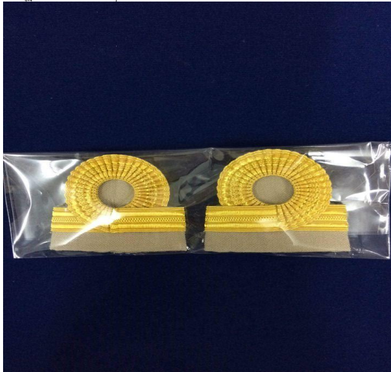
ภาพที่ ๑๒ : อินทระณูเครื่องแบบปฏิบัติราชการ (สีกากี) ระดับซี ๒

ระดับซี ๑ : เครื่องแบบปฏิบัติราชการ (ชุดกากี) ๒ แแถบเล็ก อย่างบาง แแถบบนขมวด