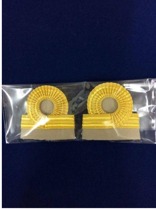
ภาพที่ ๑๑ : อินทระณูเครื่องแบบปฏิบัติราชการ (สีกากี) ระดับซี ๑

ระดับซี ๑ : เครื่องแบบปฏิบัติราชการ (ชุดกากี) ๒ แแถบเล็ก อย่างบาง แแถบบนขมวด