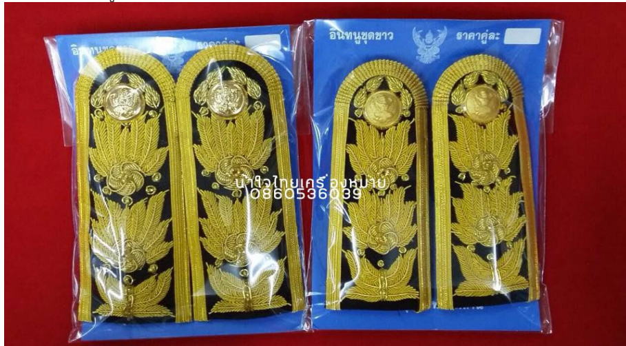
ภาพที่ ๒๔ : อินทรรูปของเครื่องแบบพิธีการ (ชุดปกติขาว) ตำแหน่งระดับ ๗-๘

พนักงานองค์กรปกครองส่วนท้องถิ่น ตำแหน่งระดับ ๕ และระดับ ๖ : มีแถบสีทอง กว้าง ๑ เซนติเมตร เป็นขอบและปักด้นสีทองลายช่อชัยพฤกษ์มีดอก ๓ ดอก เรียงตามส่วนยาวของอินทรรูปไม่ เกิน ๓ ใน ๔ ส่วนของอินทรรูป