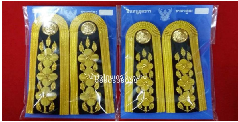
ภาพที่ ๒๓ : อินทรรูปของเครื่องแบบพิธีการ (ชุดปกติขาว) ตำแหน่งระดับ ๕-๖

พนักงานองค์กรปกครองส่วนท้องถิ่น ตำแหน่งระดับ ๕ และระดับ ๖ : มีแถบสีทอง กว้าง ๑ เซนติเมตร เป็นขอบและปักด้นสีทองลายช่อชัยพฤกษ์มีดอก ๓ ดอก เรียงตามส่วนยาวของอินทรรูปไม่ เกิน ๓ ใน ๔ ส่วนของอินทรรูป