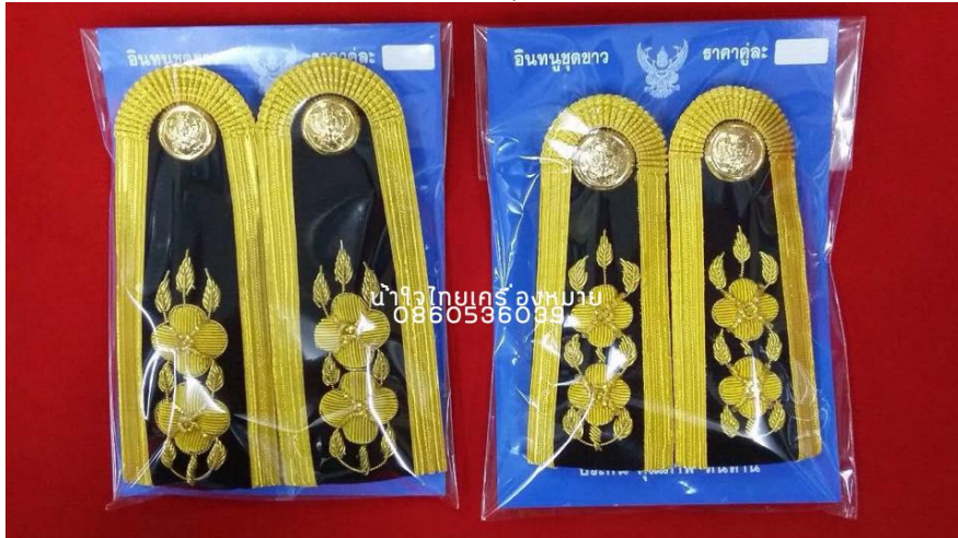
ภาพที่ ๒๒ : อินทธรณูของเครื่องแบบพิธีการ (ชุดปกติขาว) ตำแหน่งระดับ ๓-๔