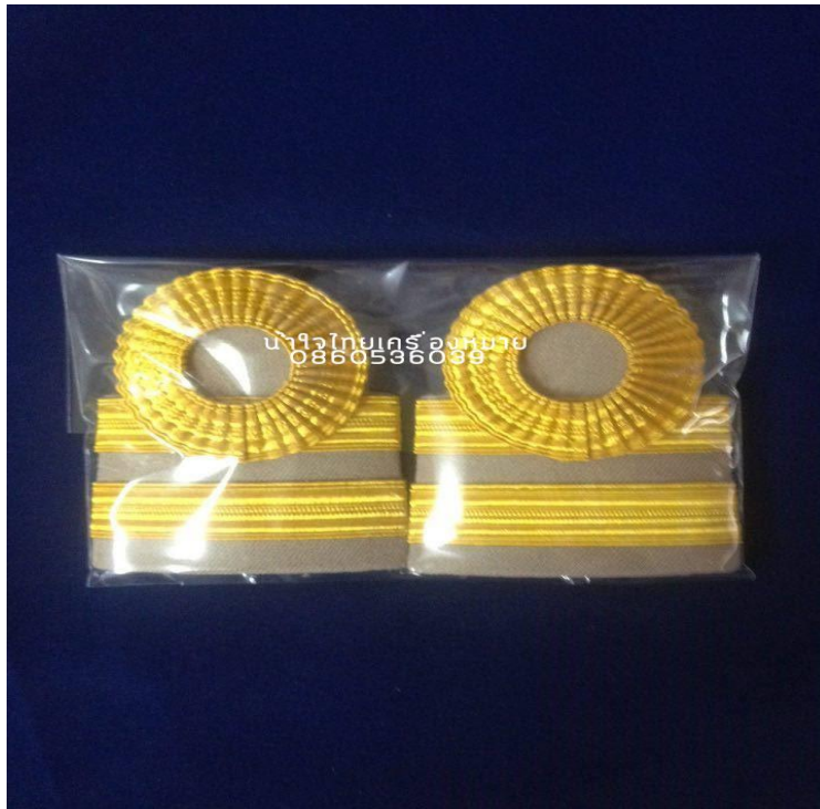
ภาพที่ ๑๘ : อินทธนูเครื่องแบบปฏิบัติราชการ (สีกากี) ของลูกจ้างประจำ ระดับซี ๓-๔

ลูกจ้างประจำที่มีอัตราค่าจ้างเท่ากับเงินเดือนขั้นต่ำของข้าราชการ ระดับ ๓ และ ๔ : เครื่องแบบปฏิบัติราชการ (ชุดกากี) ๒แถบเล็กอย่างอ่อน แถบบนขมวดกลมไม่ตัวดปลาย