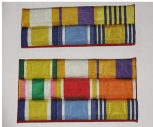
ภาพที่ ๑๐ : แพรแถบสี

หลายคนคงเคยสงสัยเวลาที่เห็นเครื่องแบบราชการพลเรือน หรือข้าราชการส่วนท้องถิ่นบริเวณอกด้านซ้ายจะมีแถบสีลักษณะต่างกันไป แถบสีนั้นเรียกว่า “แพรแถบย่อ” ซึ่งจะมีชั้น ชั้นละกี่เหรียญก็ตามแต่ ซึ่งโดยทั่วไปจะมีชั้นละ ๓ เหรียญ แพรแถบทำด้วยผ้าแพรแถบ ไม่มีพลาสติกหุ้มติดที่หน้าอกเหนือกระเป๋าด้านซ้าย ประมาณ ๐.๕ เซนติเมตร ในตอนต้นนี้จะกล่าวถึงแพรแถบย่อเหรียญที่ระลึกก่อนเพราะถือเป็นแพรแถบขั้นต้นที่สามารถปรับระดับได้ เหรียญที่ระลึกเนื่องในวโรกาสต่างๆ จะใช้ประดับชุดปกติขาวในงานพิธีการหรือชุดปฏิบัติงาน (ชุดกาเกี)