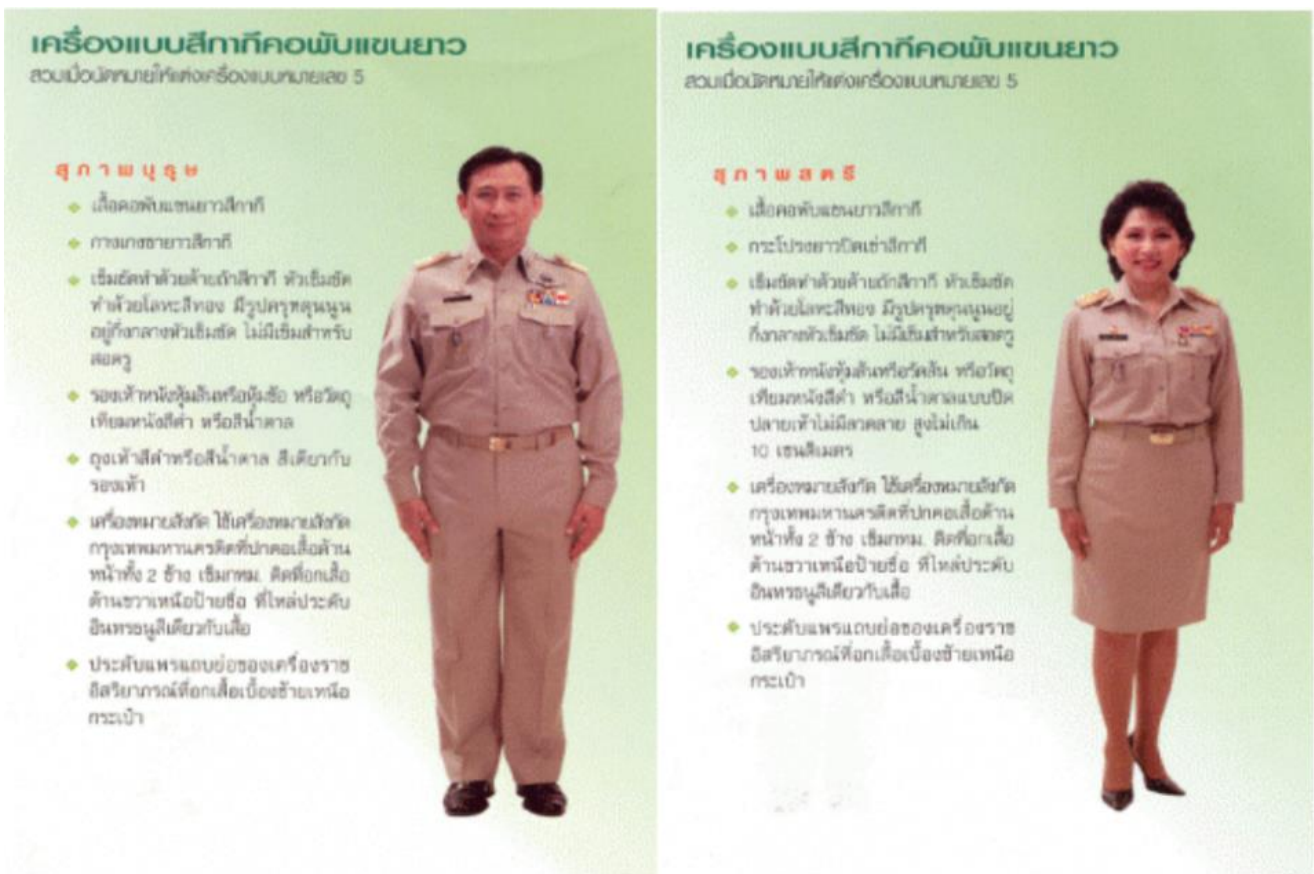
ภาพที่ ๑ : ตัวอย่างเครื่องแบบกากีคอพับ (แขนยาว / แขนสั้น)