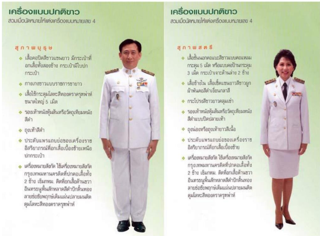
ภาพที่ ๓ : ตัวอย่างเครื่องแบบปกติขาว

๒. เครื่องแบบเครื่องยศ หรือปกติขาวครึ่งยศ (กางเกงดำ + เสื้อขาว) เครื่องราชลักษณะ และ ส่วนประกอบเช่นเดียวกับเครื่องแบบปกติขาว เว้นแต่กางเกงหรือกระโปรง ให้ใช้ผ้าสักหลาดหรือเสิร์จสีดำประดับเครื่องราชอิสริยาภรณ์