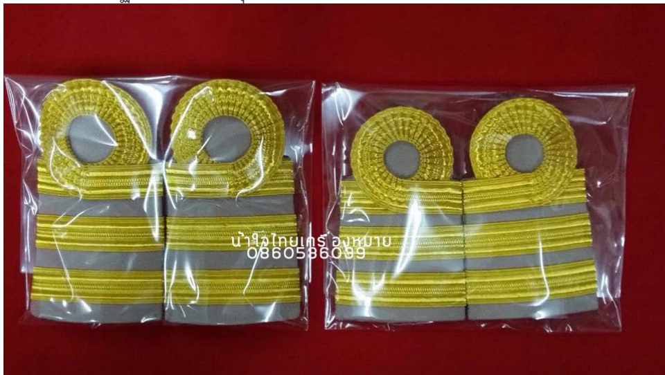
ภาพที่ ๑๔ : อินทธรณูเครื่องแบบปฏิบัติราชการ (สีกากี) ระดับซี ๕-๖

ระดับซี ๓-๔ : เครื่องแบบปฏิบัติราชการ (ชุดกากี) ๒ แถบเล็ก แถบบนขมวด