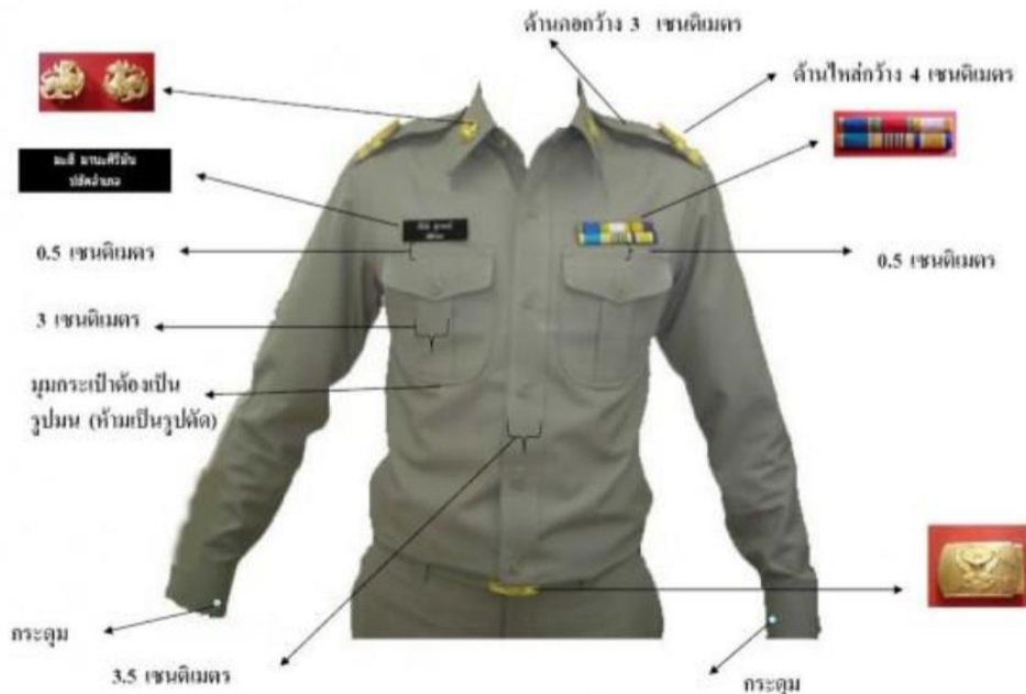
ภาพที่ ๖ : ภาพรวมการแต่งกายข้าราชการส่วนท้องถิ่น

การประดับเครื่องหมายข้าราชการส่วนท้องถิ่น