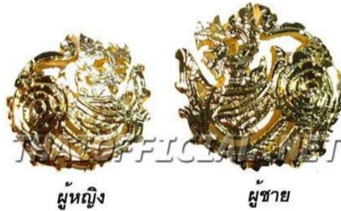
ภาพที่ ๙ : เครื่องหมายแสดงสังกัด