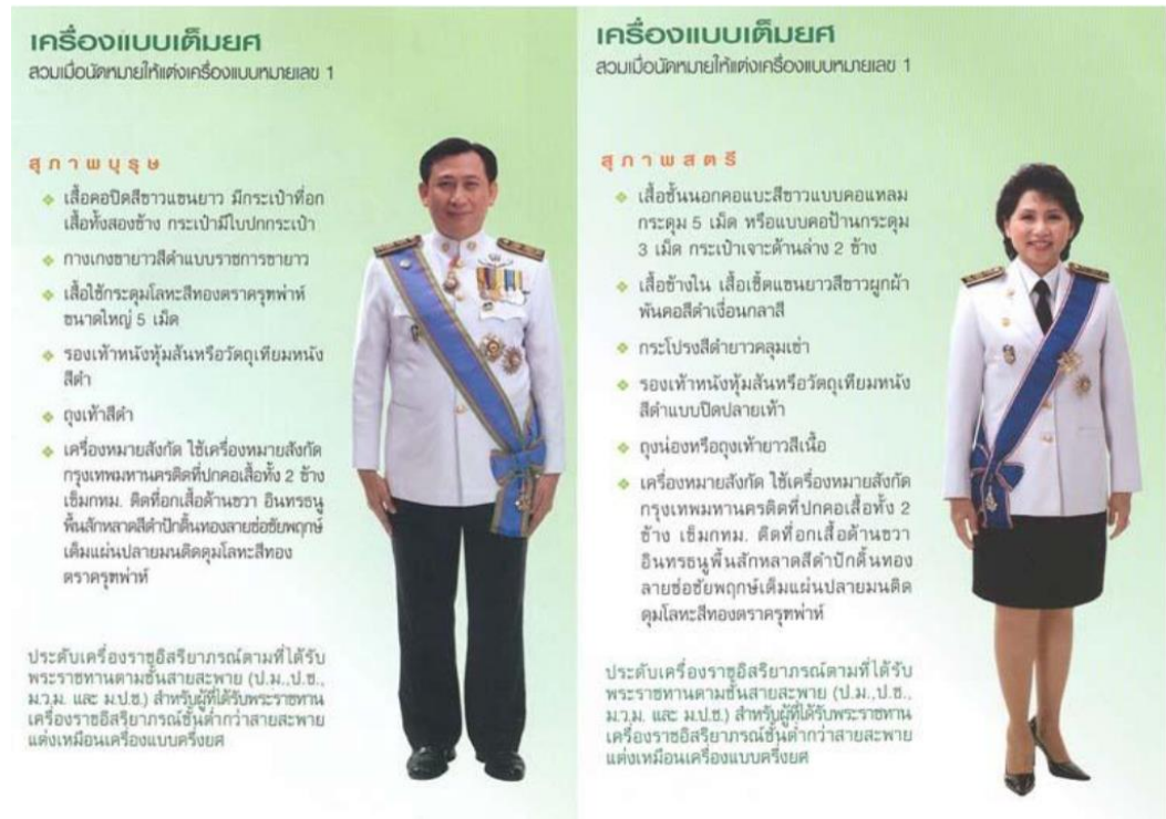
ภาพที่ ๕ : ตัวอย่างเครื่องแบบเต็มยศ

นิยมแต่งในวันที่ ๕ ธันวาคมหาราช ลักษณะและส่วนประกอบเช่นเดียวกับเครื่องแบบครึ่งยศ สวมสายสะพาย