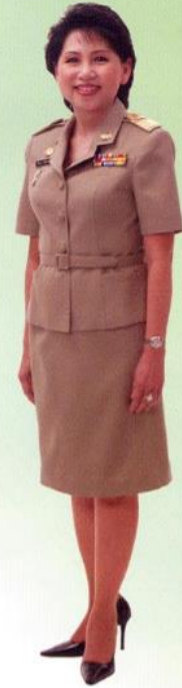
ภาพที่ ๒ : ตัวอย่างเครื่องแบบกากีคอแบะ