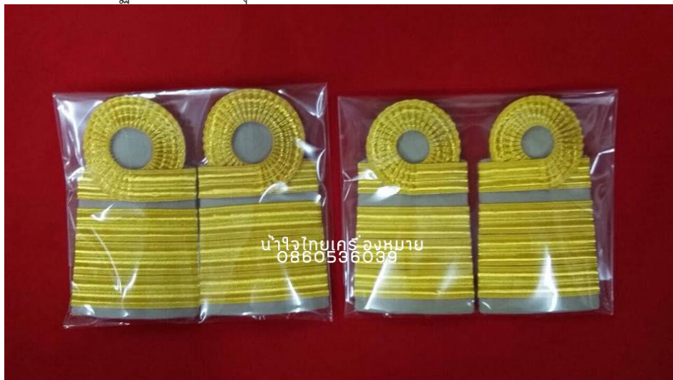
ภาพที่ ๑๕ : อินทธรณูเครื่องแบบปฏิบัติราชการ (สีกากี) ระดับซี ๗-๘

ระดับซี ๕-๖ : เครื่องแบบปฏิบัติราชการ (ชุดกากี) ๓ แถบเล็ก แถบบนขมวด