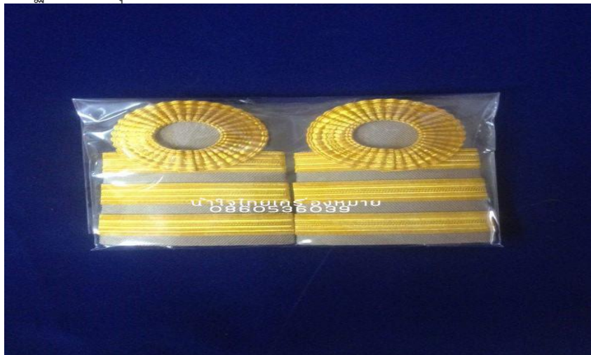
ภาพที่ ๑๙ : อินทธนูเครื่องแบบปฏิบัติราชการ (สีกากี) ของลูกจ้างประจำ ระดับซี ๕-๖

ลูกจ้างประจำที่มีอัตราค่าจ้างเท่ากับเงินเดือนขั้นต่ำของข้าราชการ ระดับ ๓ และ ๔ : เครื่องแบบปฏิบัติราชการ (ชุดกากี) ๒แถบเล็กอย่างอ่อน แถบบนขมวดกลมไม่ตัวดปลาย