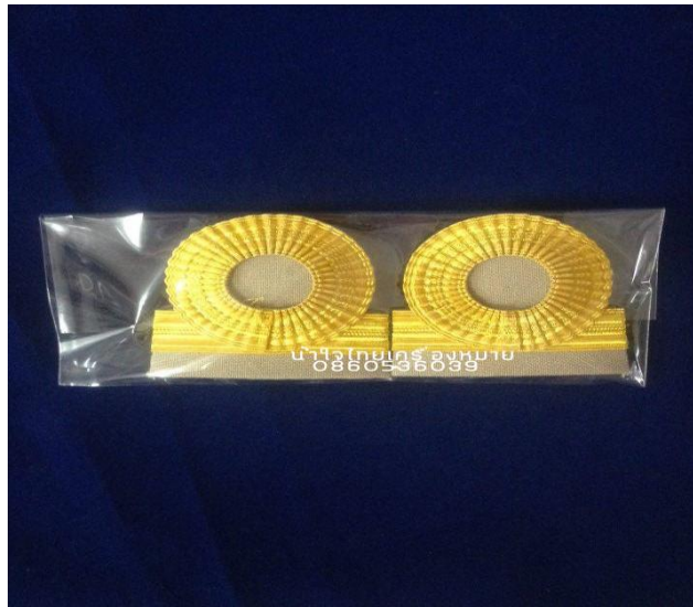
ภาพที่ ๑๗ : อินทณเครื่องแบบปฏิบัติราชการ (สีกากี) ของลูกจ้างประจำ ระดับซี ๑-๒

ลูกจ้างประจำที่มีอัตราค่าจ้างเท่ากับเงินเดือนขั้นต่ำของข้าราชการ ระดับ ๑ : เครื่องแบบปฏิบัติราชการ (ชุดกากี) ๒ แแถบเล็กอย่างบาง กว้าง ๕ มิลลิเมตร แแถบบนขมวดกลมไม่ตวัดปลาย