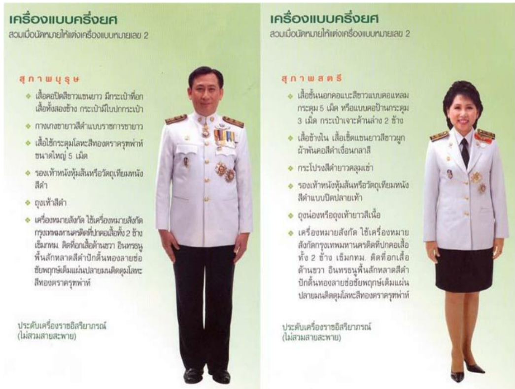
ภาพที่ ๔ : ตัวอย่างเครื่องแบบครึ่งยศ

๒. เครื่องแบบเครื่องยศ หรือปกติขาวครึ่งยศ (กางเกงดำ + เสื้อขาว) เครื่องราชลักษณะ และ ส่วนประกอบเช่นเดียวกับเครื่องแบบปกติขาว เว้นแต่กางเกงหรือกระโปรง ให้ใช้ผ้าสักหลาดหรือเสิร์จสีดำประดับเครื่องราชอิสริยาภรณ์