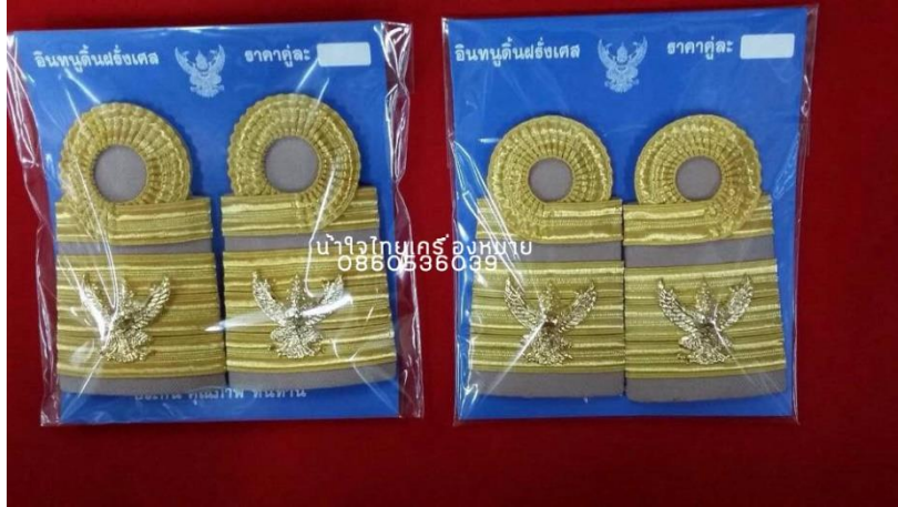
ภาพที่ ๑๖ : อินทณเครื่องแบบปฏิบัติราชการ (สีกากี) ระดับซี ๗ขึ้นไป

ระดับซี ๗ -๘ : เครื่องแบบปฏิบัติราชการ (ชุดกากี) ๑ แแถบใหญ่ แแถบบนขมวด