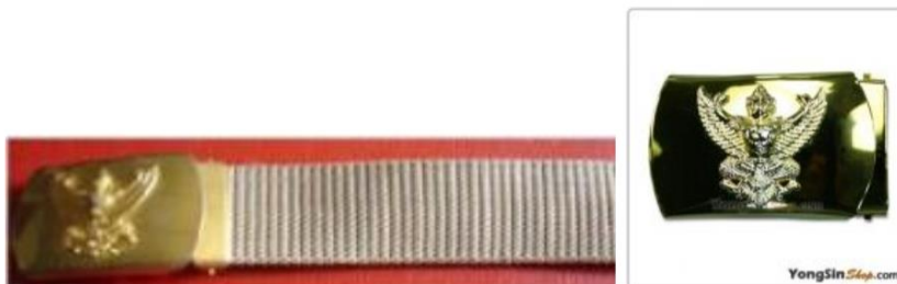
ภาพที่ ๘ : เข็มขัด

กว้าง ๓.๕ เซนติเมตร ยาว ๕ เซนติเมตร มีครุฑอยู่ตรงกลางหัวเข็มขัด ขณะคาดเข็มขัดห้ามคาดเข็มขัดปล่อยชายยาว ปลายเข็มขัดควรโผล่เฉพาะที่หุ้มด้วยโลหะเท่านั้น หรือไม่มีก็สอดซ่อนปลายไว้