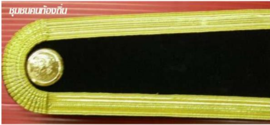
ภาพที่ ๒๐ : อินทธรณูของเครื่องแบบพิธีการ (ชุดปกติขาว) ตำแหน่งระดับ ๑ พนักงานองค์กรปกครองส่วนท้องถิ่น ตำแหน่งระดับ ๑ : มีแถบสีทองกว้าง ๕ มิลลิเมตร เป็นขอบพื้นลำด้าล้วน ไม่มีช่อชัยพฤกษ์