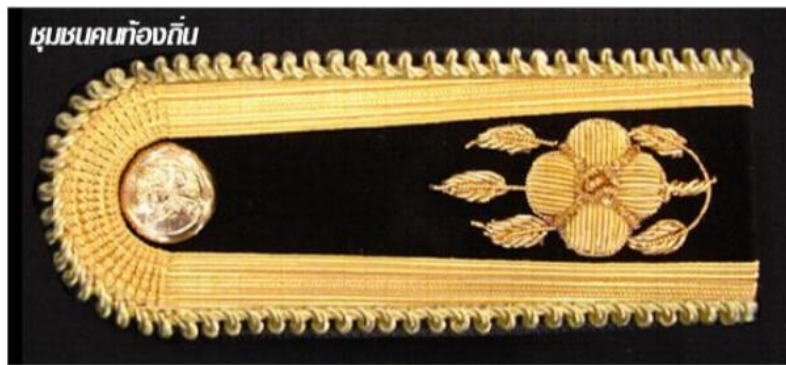
ภาพที่ ๒๑ : อินทธรณูของเครื่องแบบพิธีการ (ชุดปกติขาว) ตำแหน่งระดับ ๒