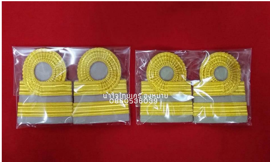
ภาพที่ ๑๓ : อินทธรณูเครื่องแบบปฏิบัติราชการ (สีกากี) ระดับซี ๓-๔

ระดับซี ๓-๔ : เครื่องแบบปฏิบัติราชการ (ชุดกากี) ๒ แถบเล็ก แถบบนขมวด